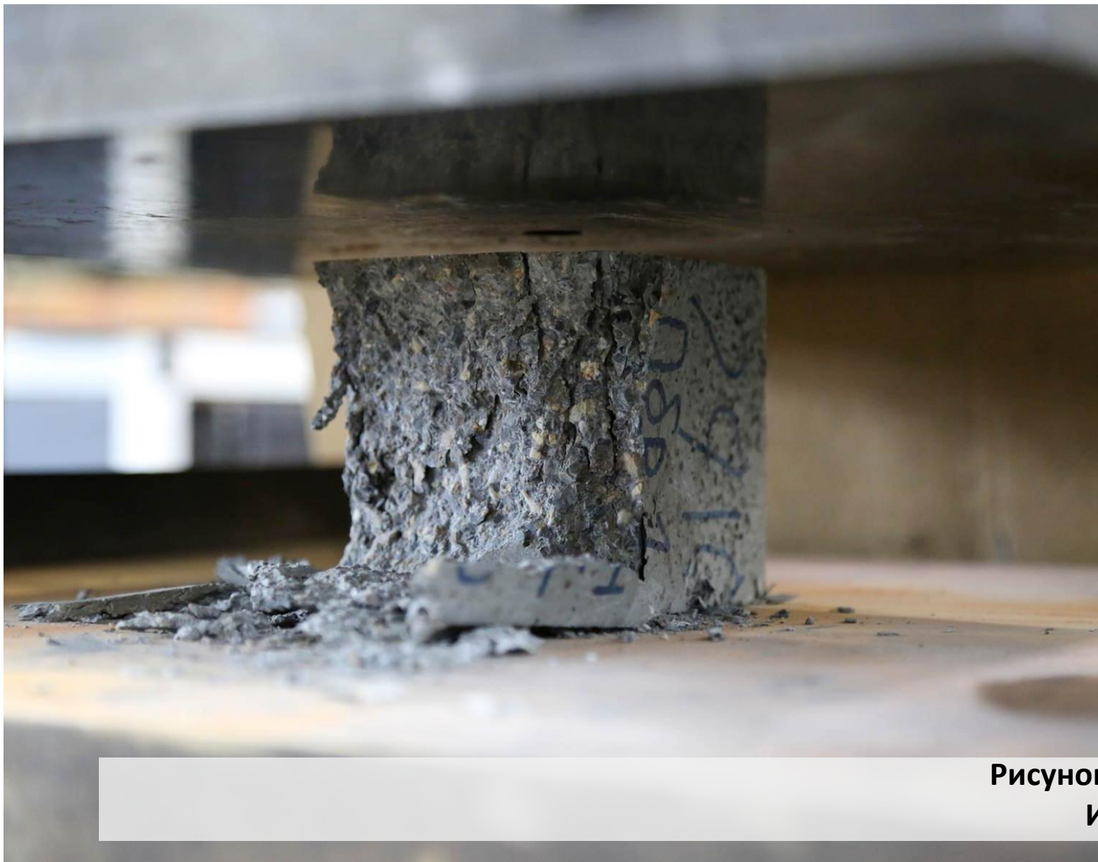
Рисунок: название